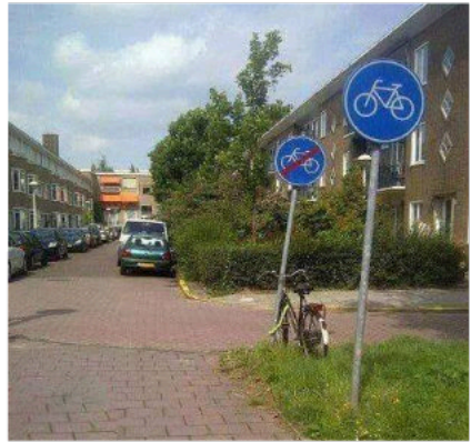
Drie meter fietspad!