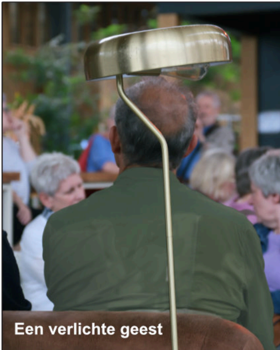
Een verlichte geest

Amai zeg wauw, da's straf! Een musical over enkele Okra-leden! ?