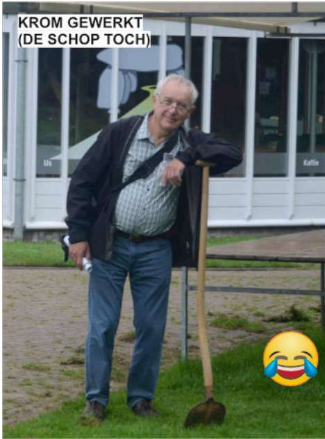
KROM GEWERKT (DE SCHOP TOCH)

"Lezen?" vraagt de Pool... "ik ken die vent!!"