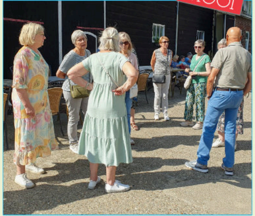
14.07.2023. Lekkerbekkentocht Zeeland