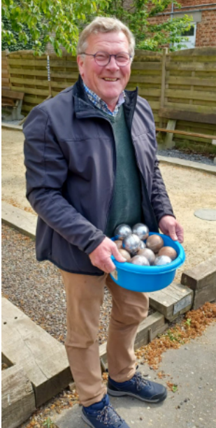
MAN MET BALLEN