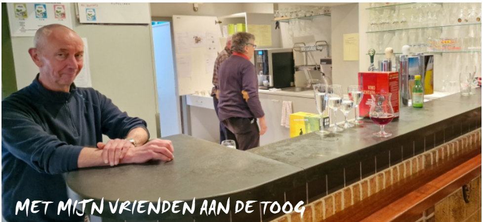
MET MIJN VRIENDEN AAN DE TOOG