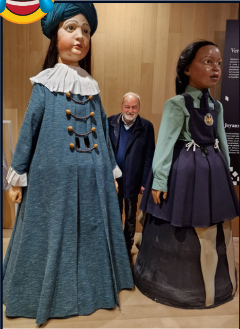
Tentoonstelling "Verborgen Parel" te Mechelen: zoek de verborgen parel

Eindelijk de vierde aap! De som van de andere.... Hij ziet niemand, hij hoort niemand en hij spreekt tegen niemand!