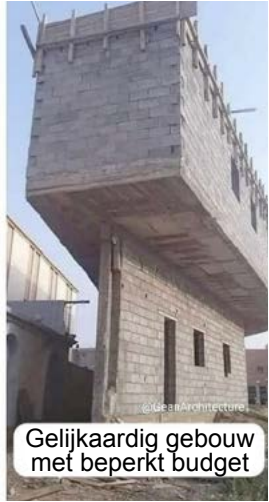
Gelijkaardig gebouw met beperkt budget