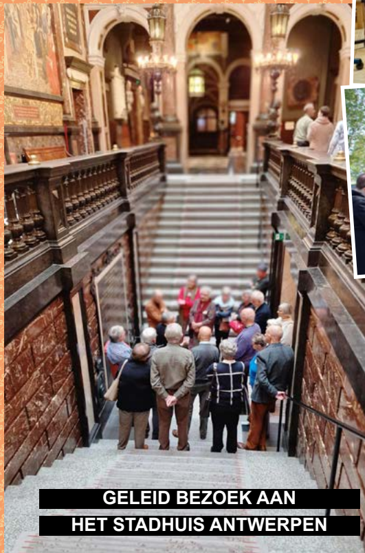
GELEID BEZOEK AAN HET STADHUIS ANTWERPEN

Deze en nog veel meer foto's van onze activiteiten vind je op onze website www.okra-boom-park.be/fotos/