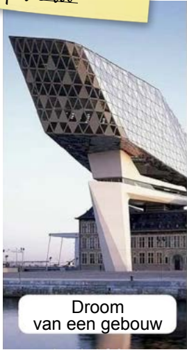
Droom van een gebouw

Dit nog geweten? Voor de kerstvakantie de klas poetsen... én... de speelkoer vegen!